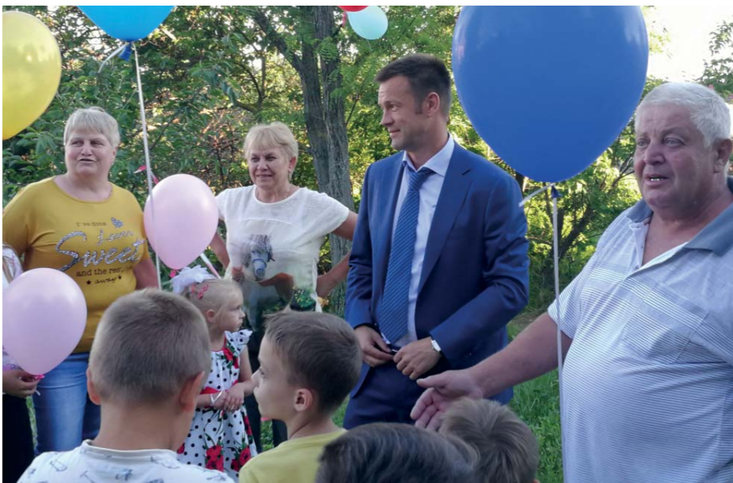
2 стр. >>

Чтобы не было метаний, здесь четко определили, в каком направлении будет развиваться город и район.